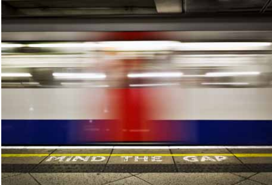
"Mind The Gap".