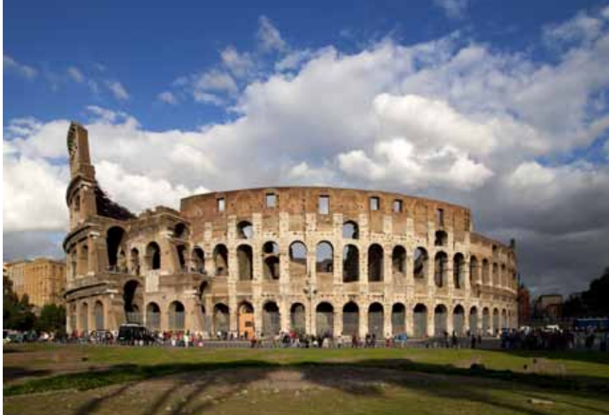
"Roma caput mundi".

Culla della civiltà occidentale e centro della cristianità, Roma è il condensato di quasi 3000 anni di storia. La capitale d'Italia è la città con la più alta concentrazione di beni artistici e architettonici del mondo. Una stratificazione di epoche e stili: romano, medievale, rinascimentale, barocco, neoclassico sino agli edifici littori. Il centro storico e le proprietà della Santa Sede nella città sono Patrimonio dell'Umanità dell'UNESCO. Roma è anche l'unica città al mondo ad avere al suo interno uno stato indipendente, Città del Vaticano . Il centro è costituito dai famosi sette colli : Viminale e Quirinale (a nord), Celio (a nord-est), Esquilino (a est),